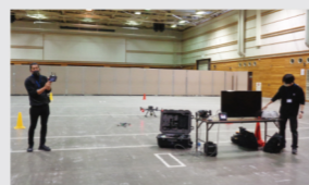
ドローン操作体験