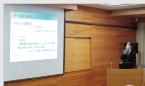
旭川中央警察署による解説